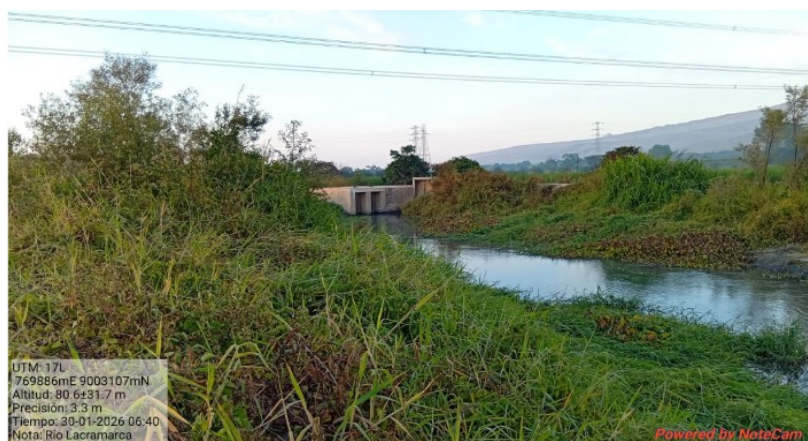
FIGURA N°01: TRAMO CRÍTICO EN EL RÍO LACRAMARCA PARA LIMPIEZA Y DESCOLMATACIÓN EN EL SECTOR SAN JOSE, DISTRITO DE CHIMBOTE, PROVINCIA DE SANTA - ANCASH.