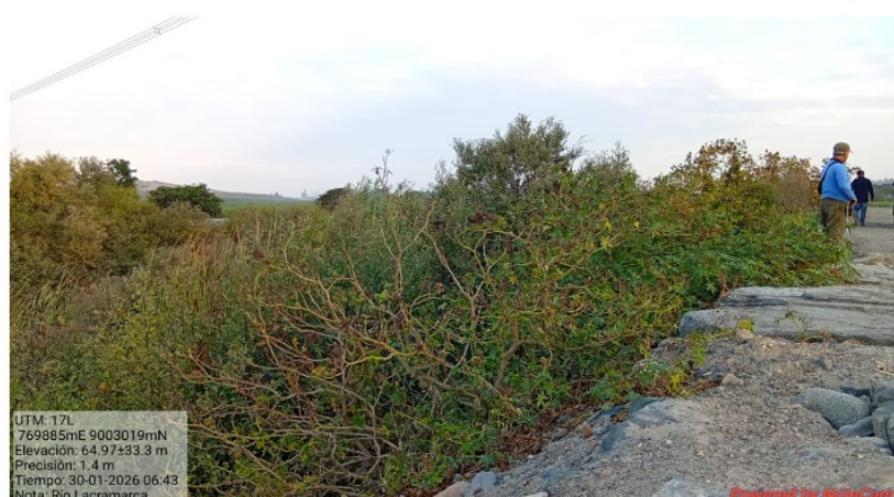
FIGURA N°02: SE APRECIA EL TRAMO COLMATADO Y EXPUESTO AL PELIGRO YA QUE NO CUENTA CON DIQUE NI PROTECCION DE ENROCADO, EL CUAL ES NECESARIO SU REFORZAMIENTO Y LA PROTECCION EN CARA HUMEDA DEL RIO LACRAMARCA.