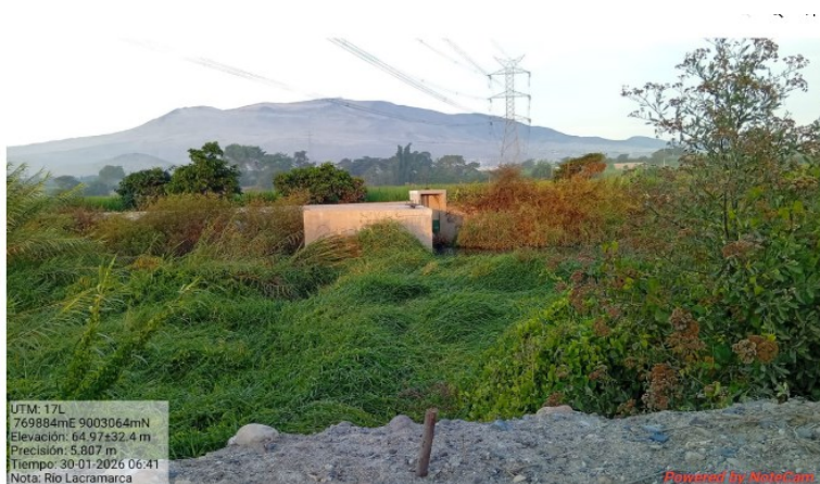
FIGURA N°03: PROPENSO A DESBORDE Y AFECTAR AREAS DE CULTIVOS Y POBLACION DEL SECTOR.