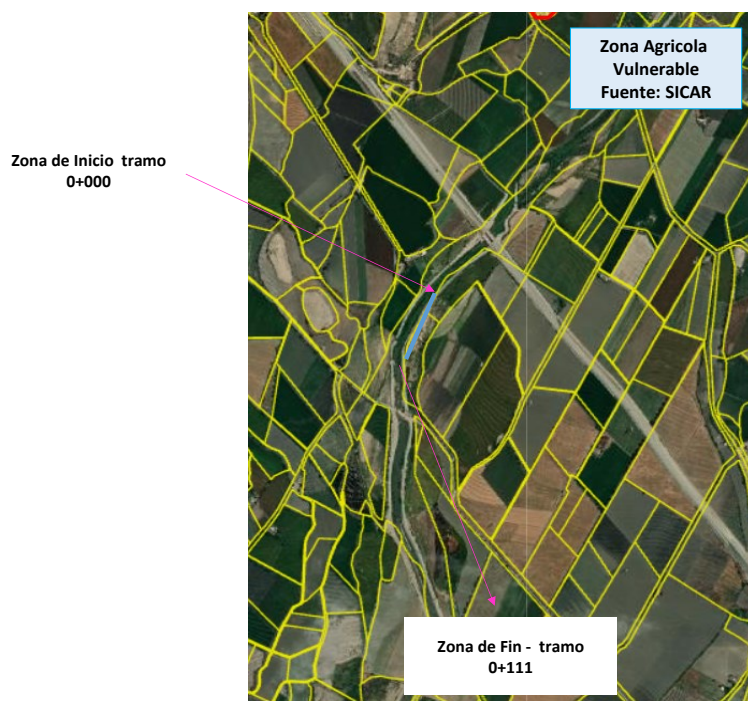
FOTOGRAFÍA N° 03: Zonas vulnerables en Zona Agrícola y Sector san jose en el tramo de la Prog 0+000 Hasta Prog: 0+110